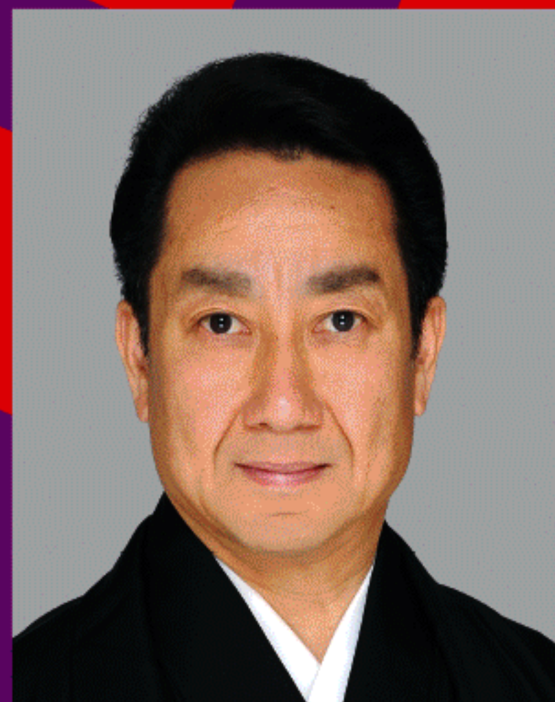
特別ゲスト 中村扇雀丈(歌舞伎俳優)